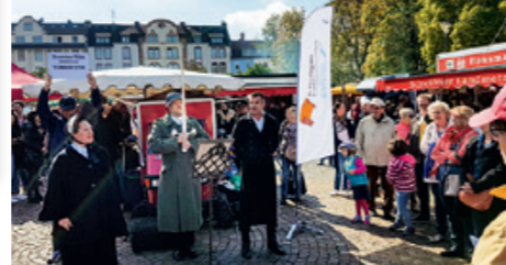
Plakat-Ausstellung vor der Paulskirche, Frankfurt a.M. / Theateraktion Marktrufert auf dem Wochenmarkt in Offenbach a.M.