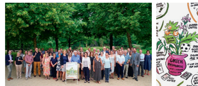
Teilnehmer*innen an der Gartentagung / „GartenRheinMain“-Bembel

Chancen und Weiterentwicklung der Gartenkultur standen im Fokus der gemeinsam mit der Verwaltung der Staatlichen Schlösser und Gärten ausgerichteten Fachtagung „Blick zurück nach vorn: Bedeutung und Zukunft der Gartenkultur in Rhein-Main“. 20 Referent*innen sprachen am 4. und 5. Juni im Staatspark Hanau-Wilhelmsbad über Gartenvisionen sowie über Qualitäten und die Zukunft des Stadtgrüns in FrankfurtRheinMain. Teil der Kooperation waren die Stadt Hanau, die Deutsche Gesellschaft für Gartenkunst und Landschaftskultur e.V. und das European Garden Heritage Network.