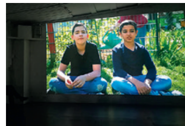
Präsentation der selbstgedrehten Videofilme im Galluszentrum