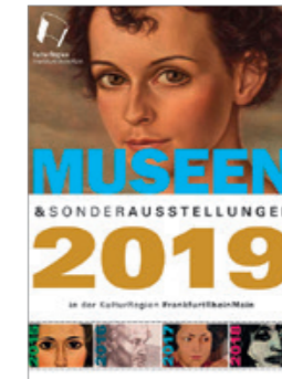
Die 10. Ausgabe des erfolgreichen Jahresplaners „Museen & Sonderausstellungen“ erscheint