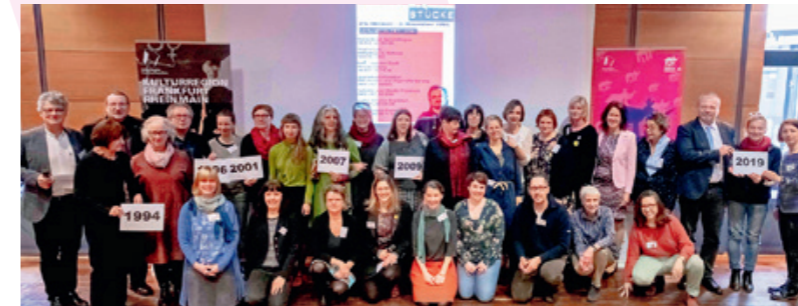
Projektbeteiligte und Veranstalter*innen seit 1994; Foto: Katrin Schander