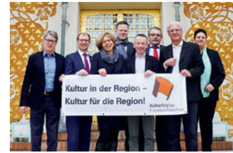
Die KulturRegion wächst um 450.000 Menschen – Jahresauftakt auf der Mathildenhöhe in Darmstadt

Seit der Gründung 1994 in Frankfurt hat sich „Starke Stücke“ in 25 Jahren zu einem erfolgreichen Netzwerk entwickelt, das sich über die gesamte Rhein-Main-Region erstreckt. 2019 wurde das Festival von 29 Kulturveranstaltern in 19 Städten gemeinsam geplant und durchgeführt. Mit 100 Vorstellungen an 41 Spielorten und einem umfangreichen Rahmen- und Workshop-Programm gehört es zu den größten, erfolgreichsten deutschen Kinder- und Jugendtheater-Festivals. „Starke Stücke“ besitzt regionale und internationale Strahlkraft und ist dabei mehr als ein Festival: Es ist ein kulturpolitischer Zusammenschluss von vielen engagierten Menschen, ein Rahmen für Vernetzung, Kooperation und Motor für Qualität und Nachhaltigkeit.