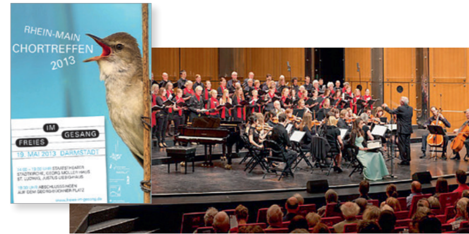
Erstes Rhein-Main-Chortreffen im Staatstheater Darmstadt; Foto: Wolfgang Günzel