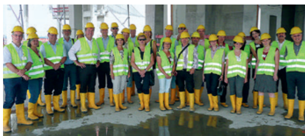
Akteur*innen der Region zu Gast auf der EZB-Baustelle, Frankfurt a.M.; Foto: Thomas Rinderspacher