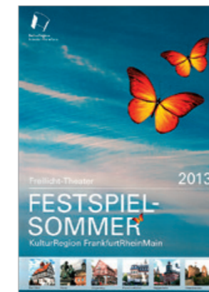
Letzte Ausgabe des Festspiel-Sommers