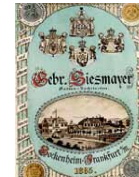
Katalog der Firma 'Gebr. Siesmayer', 1885