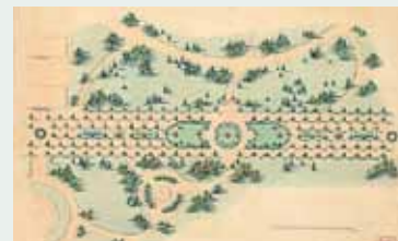
Entwurf für Teppichbeete in der Brunnenallee des Kurparks Bad Homburg