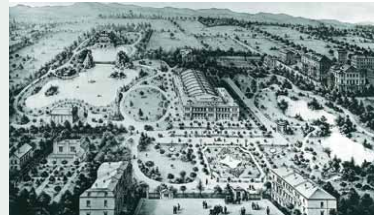
Vogelschau des Palmengartens, um 1876

Die Wanderausstellung wird vom 13. Januar bis zum 6. Februar 2011 im Rahmen der Kamelienausstellung im Palmengarten Frankfurt erstmals gezeigt. Danach geht sie auf Wanderschaft durch die Region.